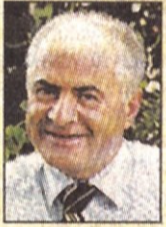
Av. Selami ÖZTÜRK Kadıköy Belediye Başkanı

Zemin haritası ile Kadıköy yeniden şekillenecek. Kadıköy genel olarak sağlam görünüyor. Kurbağalidere yatağının bulunduğu bölgeler en zayıf yerler arasında. Yatak boyunca bulunan bina ve yapıların gözden geçirilmesinde fayda var. Ayrıca Çamaşçı Deresi ile Yenisaharın yerleşim olmayan bazı lokal bölgelerinde zayıflık var. Kadıköy Belediyesi olarak bu konudaki çalışmalara büyük bir önem veriyoruz.